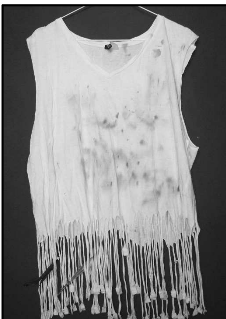
Gewinnerfoto des „skurrilsten Mitbringsels“